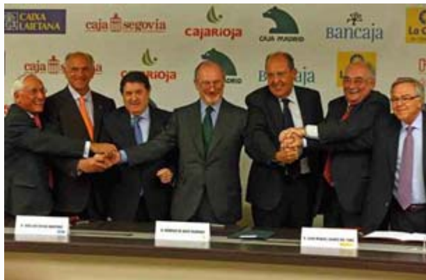
Los presidentes de las Cajas durante la firma del SIP de Caja Madrid.