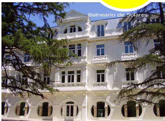
Balneario de Solares