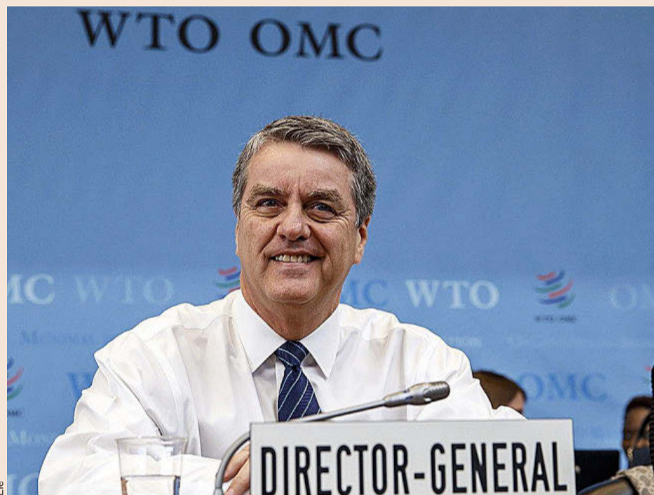
El director general de la OMC, Roberto Azevêdo, ayer en Ginebra.

Por ello, este asunto se ha vuelto la primera "prioridad" para el director general de la OMC, Roberto Azevêdo, que prometió ayer lanzar una "intensa" ronda de consultas entre los distintos países para desatascar la situación. "Un sistema de solución de controversias imparcial y vincu-