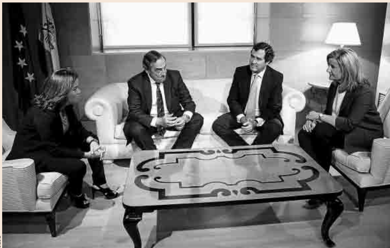
La vicepresidenta del Gobierno, Soraya Sáenz de Santamaría; el presidente de CEOE, Juan Rosell; el vicepresidente de CEOE, Antonio Garamendi, y la ministra de Empleo, Fátima Báñez, ayer.

Además, el proyecto planea procurar más incentivos fiscales para facilitar la vida de las personas mayores. Por ejemplo, actualmente quienes con esta edad venden su piso tienen una exención fiscal para las plusvalías en la venta de inmuebles. El tope actual de la exención está en los 240.000 euros.