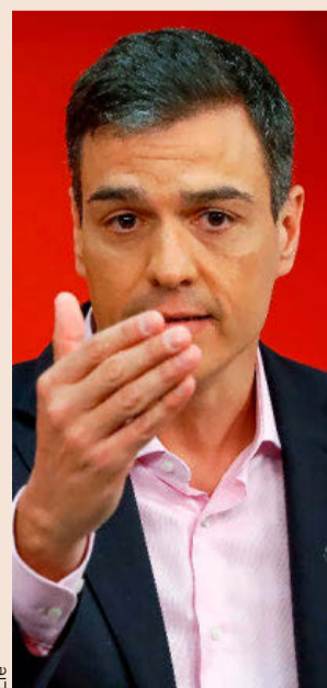
El secretario general del PSOE, Pedro Sánchez, ayer.

Por esta razón, la dotación presupuestaria del Plan Anual de Políticas de Empleo es la misma que la del año pasado: 5.674,9 millones de euros. Las partidas más importantes son los 2.500 millones, que se dedicarán a fomentar las oportunidades de empleo y los 2.250 millones, que se destinarán a la formación.