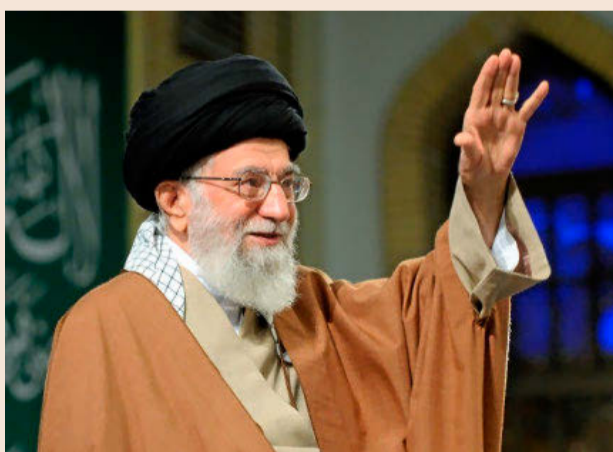
El líder supremo iraní, Alí Jameneí.

La tensión en torno al petróleo ha aumentado desde que Washington decidió no renovar las exenciones a la compra de crudo iraní otorgadas a ocho países, entre ellos China, Japón y Corea del Sur, y que concluyeron el pasado 2 de mayo. Las autori-