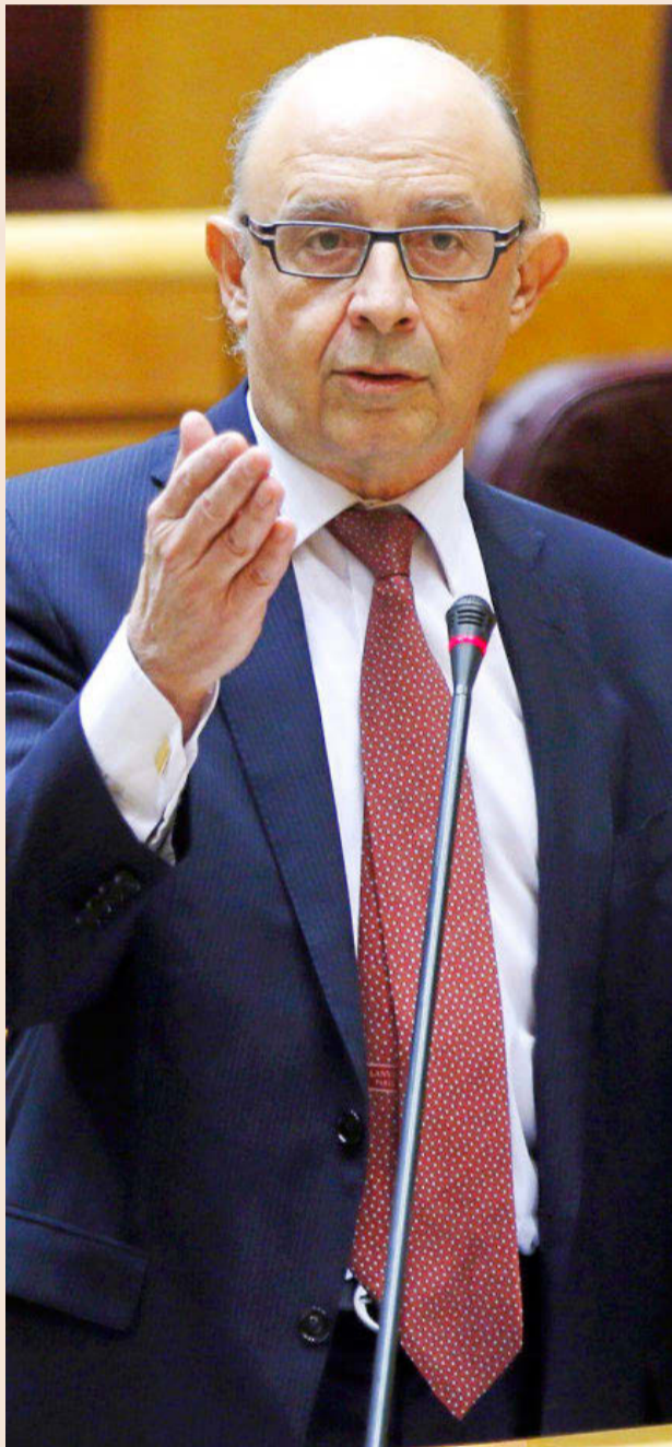
Cristóbal Montoro, ministro de Hacienda y Función Pública.

Así, consideran “totalmente insuficiente el plazo de seis meses para adaptarse, máxime cuando está pendiente de publicarse la Orden donde se deberán especificar los detalles técnicos y el formato