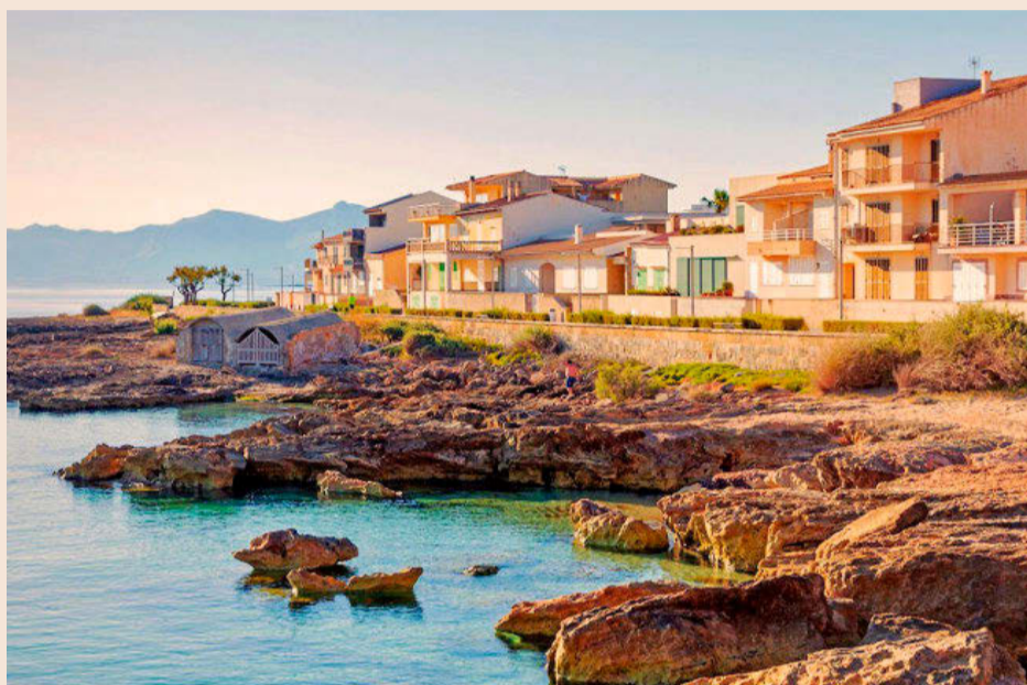
En la imagen, Can Picafort, en Mallorca, isla a la que le corresponde un límite de 435.707 plazas turísticas.

Las plataformas de alquiler de viviendas turísticas tendrán 15 días para adaptar su oferta a la nueva ley, según un comunicado que el Gobierno Balear envió a 30 de estas compañías. De lo contrario, las multas van desde los 20.000 euros, en el caso de propietarios que alquilen pisos a turistas, a los 400.000 euros, para inmobiliarias, intermediarios turísticos o pla-