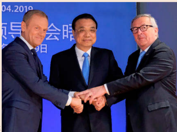
Donald Tusk, Li Keqiang y Jean-Claude Juncker, ayer en Bruselas.