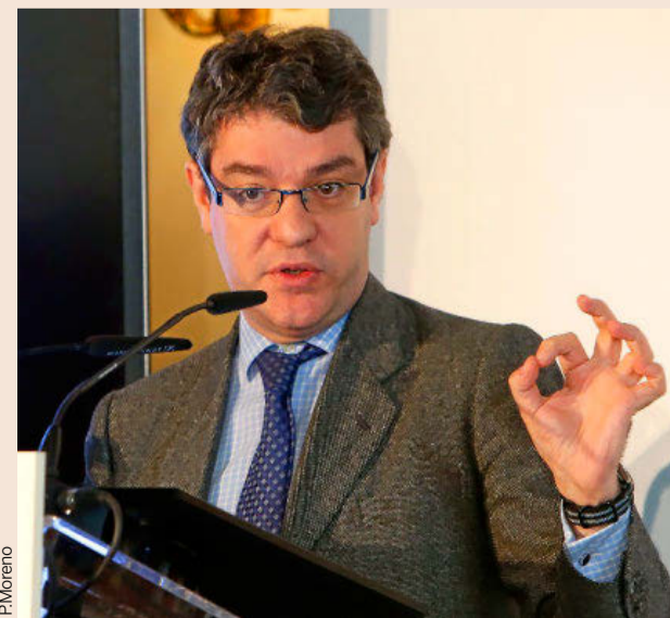
El ministro de Energía, Turismo y Agenda Digital, Álvaro Nadal, ayer.

En el escenario internacional, abogó por la firma del TTIP y reclamó "dos líneas rojas" para la negociación del Brexit: que se mantenga el principio de que "estar fuera no puede ser mejor que estar dentro" y que se preserven "lo mejor que podamos nuestras relaciones económicas".