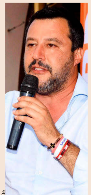
El líder de la Liga, Matteo Salvini.

Hoy los ministros de Finanzas de los 28 se verán las caras en la reunión del Eurogrupo en Luxemburgo, donde los socios del euro deberán tratar de cerrar un acuerdo sobre el presupuesto de la eurozona y apuntalar la arquitectura del euro, tarea que se antoja complicada.