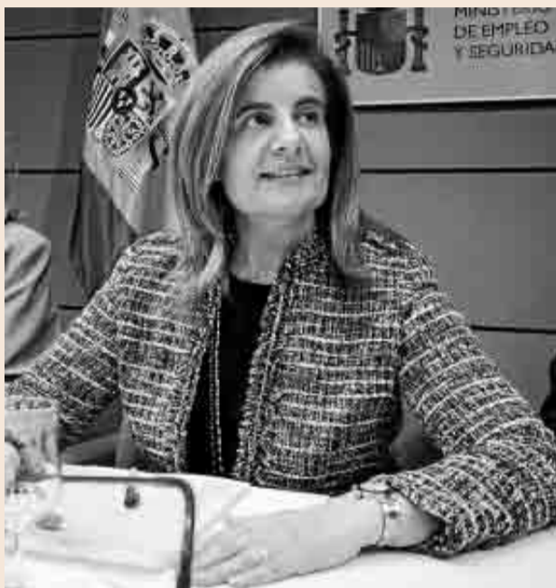
La ministra de Empleo y Seguridad Social, Fátima Báñez.

También es verdad que, con una subida de seis décimas, las retribuciones siguen ganando poder adquisitivo. En marzo, la tasa interanual de inflación es del -0,7%, lo