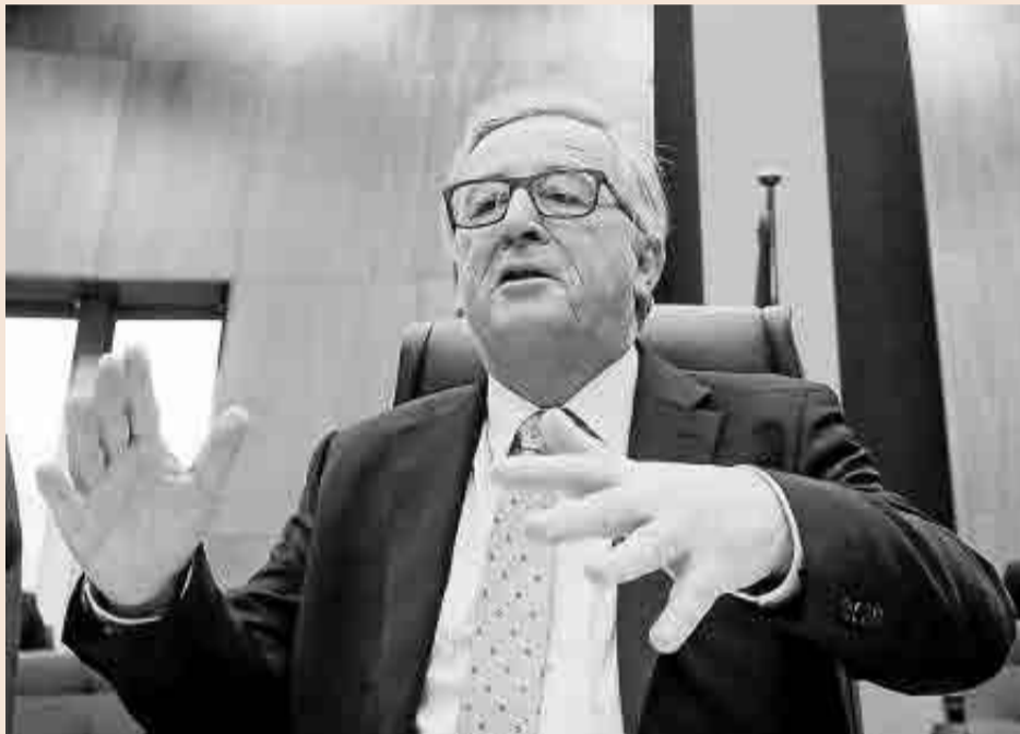
El presidente de la Comisión Europea, Jean-Claude Juncker, ayer en Bruselas.

El enfoque de la Comisión Europea de Jean Claude Juncker y del Eurogrupo pivota sobre tres ejes. El primero, no aparentar que Bruselas se está entrometiendo en