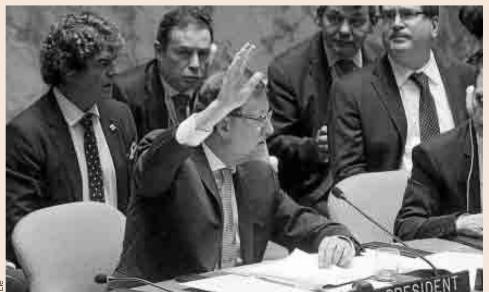
Mariano Rajoy, ayer, en la sede de la ONU de Nueva York.

A su llegada a Nueva York el domingo, Rajoy se refirió a