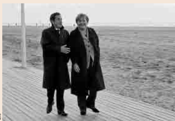
Nicolas Sarkozy y Angela Merkel pasean por Deauville en 2010.

Pero un lustro después, en la cumbre informal de ministros de Finanzas del euro que se celebró el sábado en Luxemburgo, se escuchó el eco de Deauville. Un documento de trabajo elaborado por el Ministerio de Finanzas alemán pedía instaurar un siste-