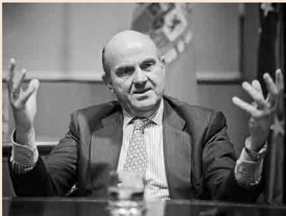
El ministro de Economía y Competitividad, Luis de Guindos.

El mayor enemigo de que se trunquen la recuperación es, según Guindos, el escenario político. “El principal riesgo es que el Ejecutivo que salga de las urnas revierta las reformas hechas en España”, advierte el ministro de Economía en una entrevista con El Periódico de Catalunya publicada ayer.