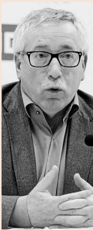
El secretario general de CCOO, Ignacio Fernández Toxo.

Sin embargo, la Audiencia Nacional, e incluso el Tribunal Supremo en los casos que llegan hasta él, han detectado que un número significativo de