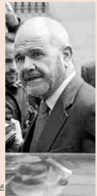
Manuel Chaves fue presidente andaluz durante 19 años.

Así, todos los titulares de estos departamentos figuran entre los imputados, como Magdalena Álvarez, José Antonio Viera, Carmen Martínez Aguayo, Manuel Recio, Francisco Vallejo, Antonio Ávila, Gaspar Zarrías, Antonio Fernández y Martín Soler.