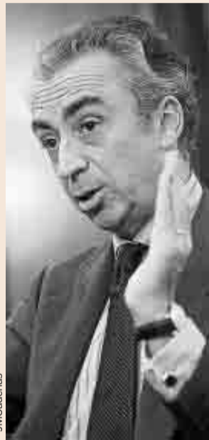
Miguel Ferre, secretario de Estado de Hacienda.

Sobre posibles cambios en los Impuestos de Sucesiones y Patrimonio, Ferre explicó que después de las elecciones se iniciará un diálogo sobre la