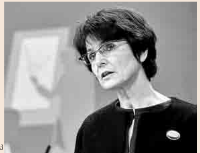
La comisaria de Empleo de la UE, Marianne Thyssen.

Sin embargo, Hacienda no desarrollará más foros de resolución de conflictos con las empresas, admitió.