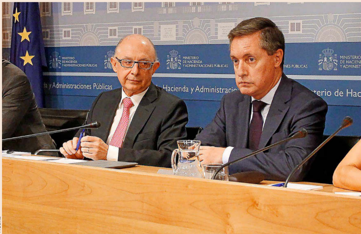
El ministro de Hacienda y Función Pública, Cristóbal Montoro, y el director de la Agencia Tributaria, Santiago Menéndez.

Además, en 2016, la Agencia Tributaria no ha podido igualar los ingresos récord de la lucha contra el fraude de 2015 de 15.664 millones de euros, y ha recaudado 14.883