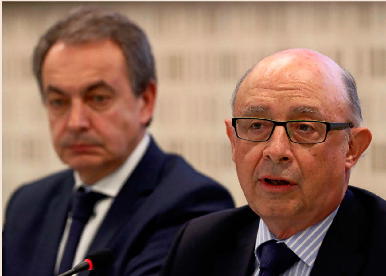
José Luis Rodríguez Zapatero, expresidente del Gobierno, y Cristóbal Montoro, ministro de Hacienda, ayer.

Pueden disfrutar de estas deducciones, que siguen el