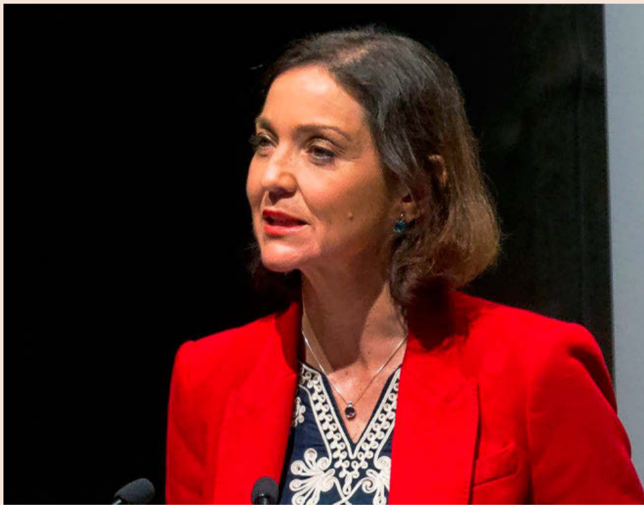
La ministra Industria, Comercio y Turismo, Reyes Maroto.