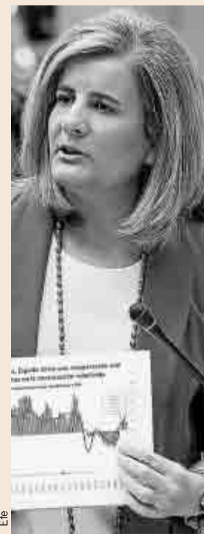
La ministra de Empleo y Seguridad Social, Fátima Báñez.

la AIReF indica que la baja inflación también implica que los salarios ganan poder adquisitivo, incluso aunque se mantengan congelados en términos nominales, por lo que lastra los ingresos del sistema. Asimismo, habla del “reducido impacto recaudatorio de las medidas de gestión adoptadas” y de los rendimientos del Fondo de Reserva, que disminuyen al ser una cantidad cada vez menor y estar invertida casi en su totalidad en deuda pública española. Por todo ello, la Autoridad Fiscal recomienda que parte de las pensiones se paguen a cargo de otros impuestos, para aliviar la situación de la Seguridad Social.