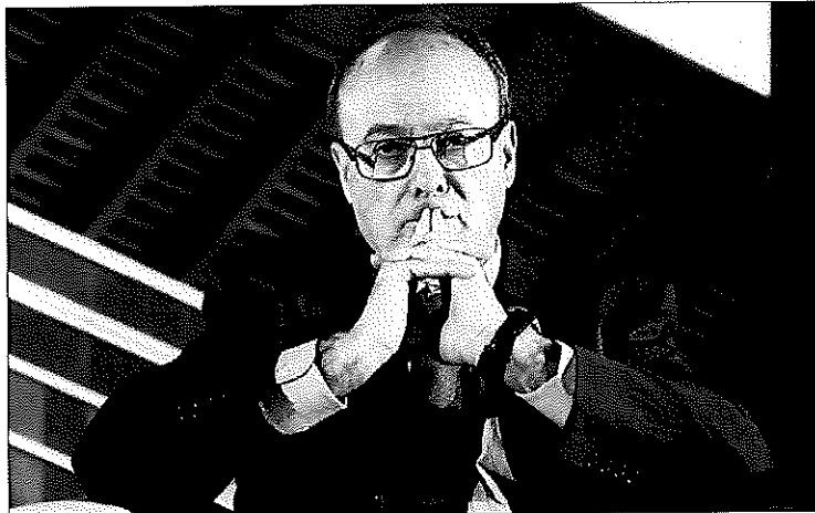
El gobernador del Banco de España, Luis Linde, en unas jornadas financieras en abril pasado.

Pero el tema más polémico en materia laboral suele ser la contratación y ahí critica que apenas se haya reducido la dualidad entre fijos y temporales y parece apuntar hacia fórmulas similares al contrato único con indemnización creciente con la antigüedad para actividades no estacionales, lo que supondría un abaratamiento del despido para los trabajadores fijos. De hecho, el Banco de España dice que el grupo de trabajadores fijos está "muy protegido" y que esa protección desincentiva