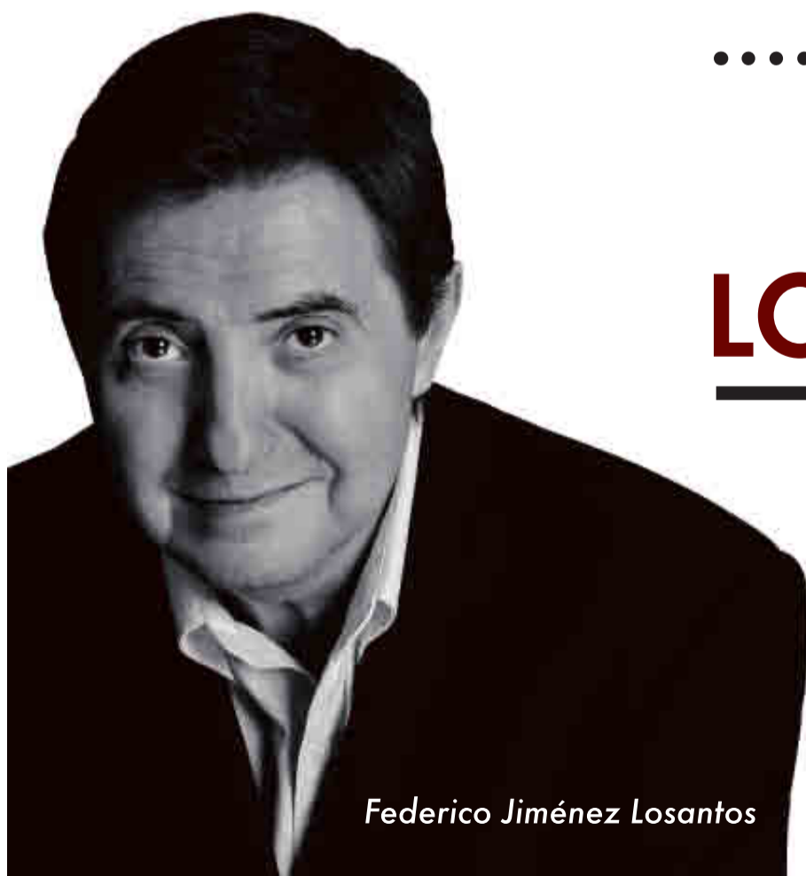
Federico Jiménez Losantos

Por eso, añadió, uno de los principales retos es «lograr que los jóvenes no tengan que marcharse y que los que se han ido puedan regresar».