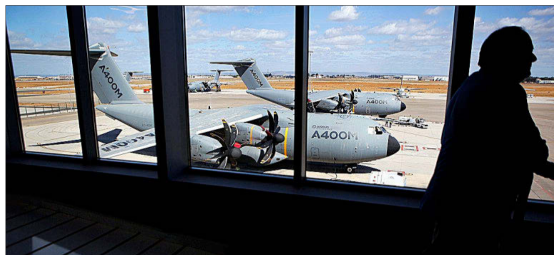
Dos aviones A400M, en la factoría del consorcio europeo Airbus en Sevilla. JESÚS MORENO