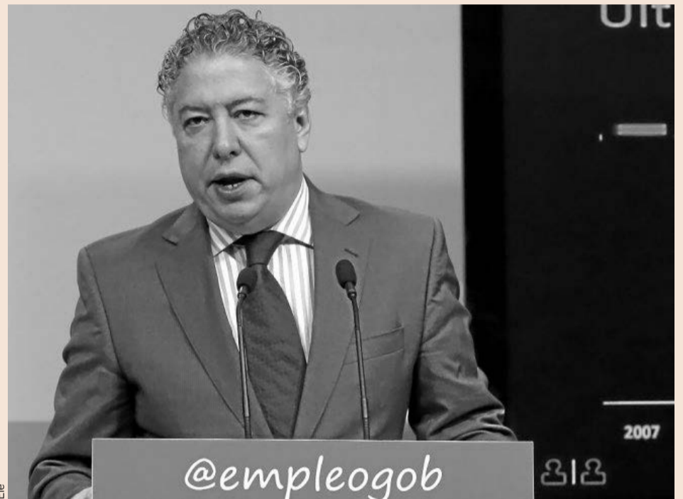
El secretario de Estado de la Seguridad Social, Tomás Burgos.

políticos está de acuerdo en plantear que los impuestos, o un tributo específico, se conviertan en el futuro en una fuente de financiación adicional de la Seguridad Social.