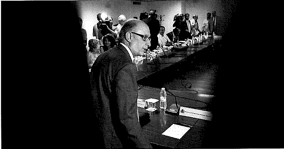
El ministro de Hacienda, Cristóbal Montoro, ayer antes de comenzar la reunión con los sindicatos del sector público.

» LA BRECHA DE LA GASOLINA El precio de los combustibles ha bajado con respecto a julio de 2014. El litro de gasolina cuesta 1,30 euros, y el de diésel, 1,13 euros. La distancia de costes entre ambos productos está en máximos: 17 céntimos.