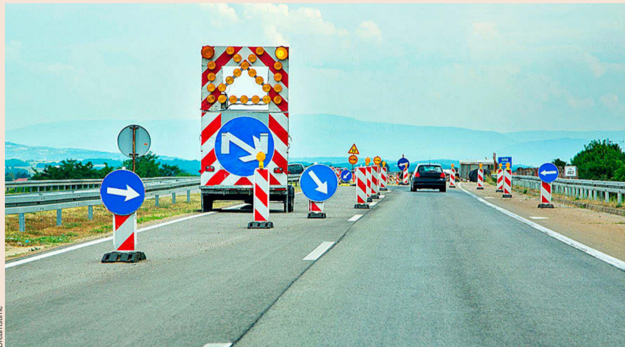
La falta de ofertas puede poner en peligro proyectos vinculados a los fondos europeos.

“En el sector estamos viendo con preocupación cómo el fuerte incremento de los precios sobre las materias primas, una coyuntura sobrevenida e imprevisible, no sólo está comprometiendo la marcha de las obras, sino que está provocando licitaciones desiertas de todo tipo, de diferentes volúmenes y de distintas administraciones”, señalan a EXPANSIÓN fuentes