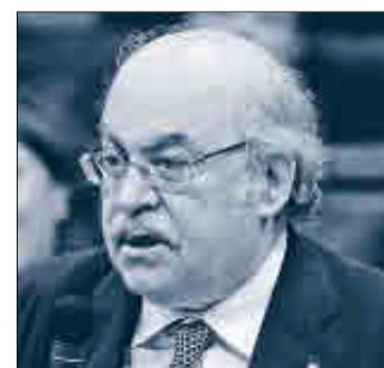
Andreu Mas-Colell.

Generalitat es consecuencia de los desequilibrios presupuestarios de los últimos años, que han hecho que el déficit de cada ejercicio se tuviera que cubrir con deuda; y como la Generalitat no ha podido acudir a los mercados financieros para obtener financiación ha tenido que recurrir al Fondo de Liquidez Autonómica (FLA) y al plan de pago a proveedores.