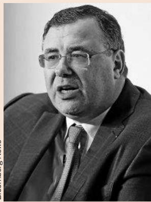
Patrick Pouyanné, consejero delegado de Total.