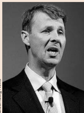
Risto Siilasmaa, presidente de Nokia.