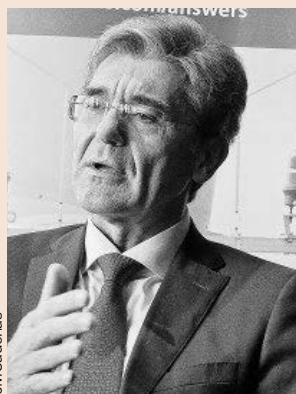
Joe Kaeser, presidente de Siemens.