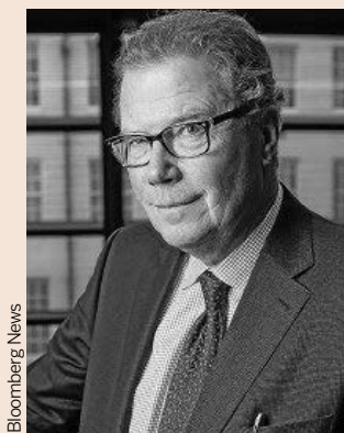
Leif Johansson, presidente de Ericsson.