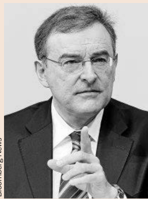
Norbert Reithofer, presidente de BMW Group.