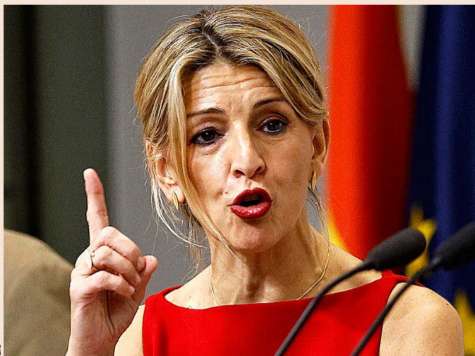
Yolanda Díaz, vicepresidenta segunda y ministra de Trabajo y Economía Social.

Sin embargo, el Gobierno de PSOE y Sumar se ha dedicado a desmontar la norma en los últimos años pese a no haberlo anunciado formalmente. Se trata de un cambio legal "silencioso", no publicitado por Moncloa para no recibir una reprimenda de la Comisión Europea, pero que ha supuesto su desandamiaje. La puntilla a la ley de desindexación sería la propuesta de Yolanda Díaz para "compensar" a las empresas subcontratistas de la Administración por las reiteradas subidas del salario mínimo. La vicepresidenta quiere usarla como moneda de cambio para lograr el apoyo de las patronales a la nueva subida del suelo salarial en 2025, atendiendo una reclamación recurrente de los representantes empresariales, que han visto cómo sus costes han crecido un 18% desde 2019. La norma en vigor impide a las compañías que trabajan con el sector público repercutir el alza de los costes en sus facturas. Una salvaguarda pensada para un contexto en el que desde el Ejecutivo se promovía el control de los mismos para blindar la competitividad empresarial y su capacidad de crear