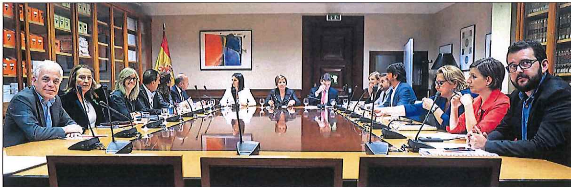
Parte de los diputados que componen el Pacto de Toledo antes de comenzar la reunión de ayer.