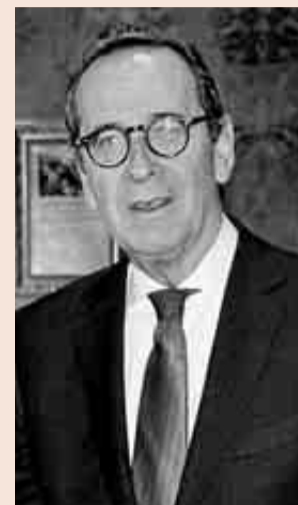
Gregorio Villalabeitia, nuevo presidente de Kutxabank.

La inversión crediticia siguió cediendo posiciones, con una caída en el grupo del 5,9%, que dejó el total en 46.973 millones. En cambio, los recursos de clientes crecieron un 1,7% y se colocaron en 63.641 millones. La entidad destaca la buena evolución de los recursos fuera de balance, con un alza del 27,9%, impulsada por los fondos de pensiones (que crecen un 8%) y, sobre todo, de inversión (41%).