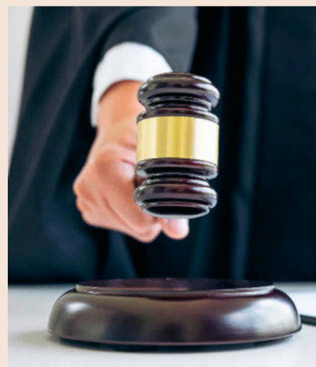
La subida irá destinada a modernizar el servicio.

El gasto en Justicia se incrementará un 3,2% en 2018, hasta los 1.753 millones de euros. Este avance se concentrará en los 132 millones para digitalizar este servicio público y un 50% más de créditos para mejorar los edificios judiciales. Dentro de esta modernización, se habilitará la entrada automática de escritos y demandas a través de LexNET y la Sede Judicial Electrónica, incrementando las funcionalidades necesarias para la tramitación electrónica y la notificación de las partes, así como la instauración de "un nuevo Registro Civil público y electrónico. También se convocarán 300 plazas de ingreso a la carrera judicial y fiscal.