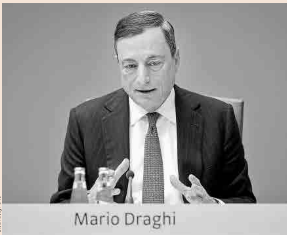
Mario Draghi, presidente del Banco Central Europeo (BCE).

El mercado no parece verlo, pese a que simplemente ampliando este horizonte temporal para el QE se inyectarán 360.000 millones de euros más en la economía durante estos seis meses. Las bolsas registraron fuertes descensos (ver pág.17) y el euro se disparaba un 1,8%, la