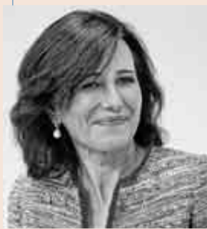
Ana Botín es presidenta de Banco Santander.