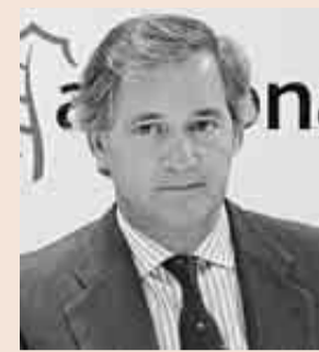
José Manuel Entrecanales, presidente de Acciona.

La siderúrgica encabeza el ránking de facturación con 69.973 millones, seguida de Airbus, Santander y Telefónica.