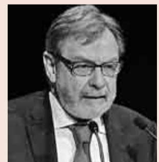
Juan Luis Cebrián, presidente de Prisa.

De las pocas compañías que debutaron en Bolsa en 2014, en su mayor parte Socimis, la que mejores resultados obtuvo es Logista, con 102,4 millones, seguida de Merlin, que ganó 49,7 millones.