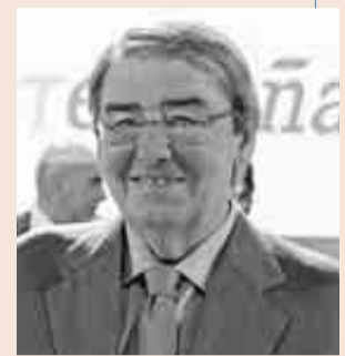
Alejandro Echevarría preside Mediaset.

Tras perder 1.972 millones en 2013 por las provisiones en su filial de renovables, ganó 185 millones el año pasado.