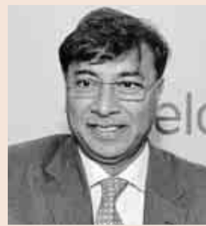
Lakshmi Mittal, presidente de ArcelorMittal.

La entidad es líder en beneficios en 2014, con 5.816 millones, un 39% más, seguida de Bayer y Endesa.