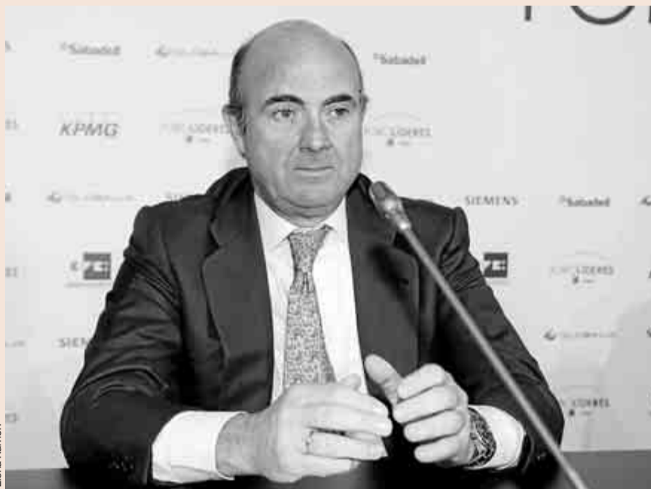
El ministro de Economía, Luis de Guindos, ayer en Barcelona.

Sin citar a Podemos y a Ciudadanos –a los que se refirió