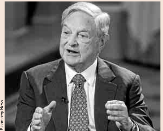
El inversor de origen húngaro George Soros.

Entretanto, más de 120 camiones rusos cargados con