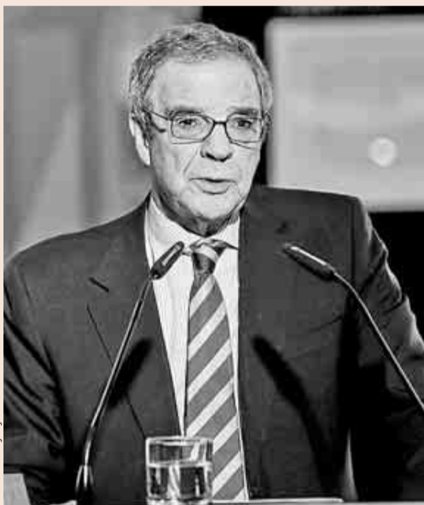
César Alierta, presidente de Telefónica y del CEC.

cerca de los años del boom económico español.