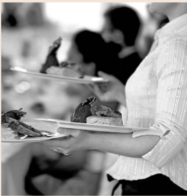
La hostelería es el sector con mejores perspectivas laborales.

Las intenciones de contratación más débiles con res-