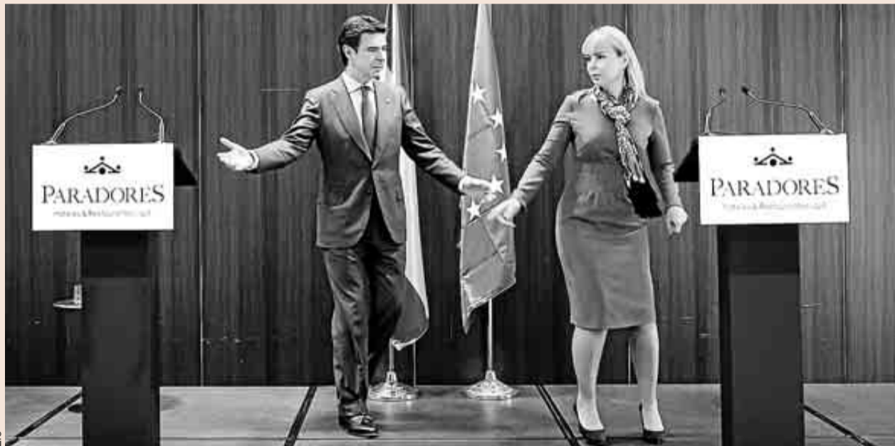
El ministro de Industria, Energía y Turismo, José Manuel Soria, junto a la comisaria europea de Mercado Interno e Industria, Elzbeta Bienkowska, ayer, en la rueda de prensa previa a la reunión de ‘Amigos de la Industria’ europeos, en Alcalá de Henares.

Por otro lado, el ministro reconoció la “preocupación” existente entre las compañías españolas por las posiciones del Gobierno de Venezuela. En los últimos días, las empresas han recibido presiones por parte de Caracas e, incluso, amenazas de expropiación si no cesaban sus críticas al Ejecutivo. En su opinión, ese país “tiene un Gobierno que no está llevando a la sociedad venezolana por el camino de prosperidad que podría llevarla”, indicó.