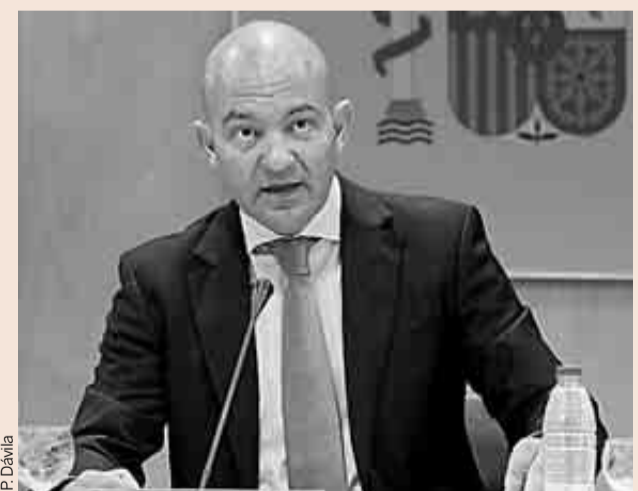
El secretario de Estado de Comercio, Jaime García-Legaz.

El dirigente subrayó la importancia de fomentar la inversión directa en España, sobre todo entre las medianas empresas, que aún tienen pendiente dar el salto internacional. A su parecer, este salto puede ser más fácil si se cuenta con un inversor internacional dentro del capital. Además, ha apostado por incre-