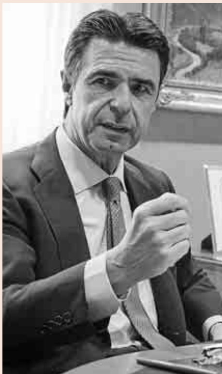
El ministro de Industria, José Manuel Soria.

De hecho, Audera resaltó la importancia de potenciar