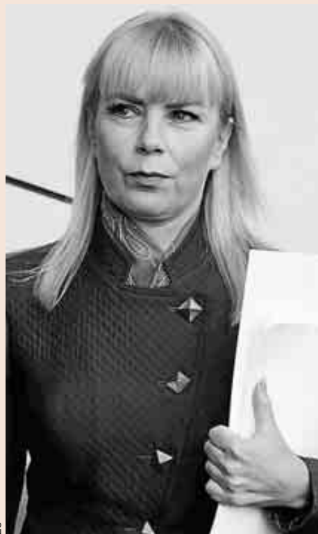
La comisaria europea Elzbieta Bienkowska.