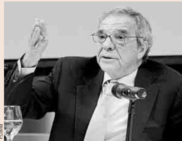
El presidente de Telefónica, César Alierta.

El presidente de la CNMC afirmó que le hubiese gustado que la modificación de la Ley de Hidrocarburos contase con el dictamen del organismo, si bien ha remitido a Industria sus sugerencias sobre la normativa.