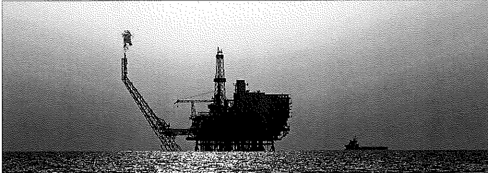
Una plataforma petrolífera cerca de la costa de Libia.

» LA DIVISA RUSA, EN MÍNIMOS. El rublo ha acelerado su depreciación en la última semana, hasta alcanzar el viernes su mínimo anual. La debilidad de la economía de Rusia hace que ahora por cada rublo solo se reciban 0,0127 euros.