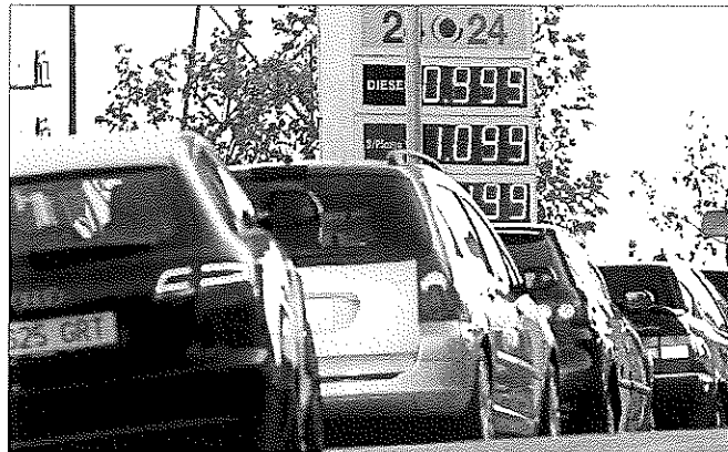
Una gasolinera de Madrid ofrecía el litro de gasóleo a menos de un euro a finales de diciembre.

Con estas cifras, la estabilización de la demanda ya es un hecho y el cierre del ejercicio en positivo solo queda condicionado a que en diciembre se hayan consumido más de 2 millones de toneladas de gasóleo y gasolina, un umbral para el último mes del año siempre superado en los últimos ejercicios. Los bajos precios de los carburantes en los surtidores es otro de los factores que pueden permitir que los 25,3 mil-