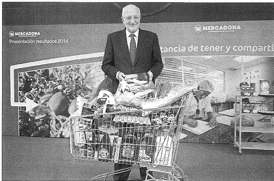
Juan Roig, presidente de Mercadona, ayer después de la presentación de resultados en Valencia.