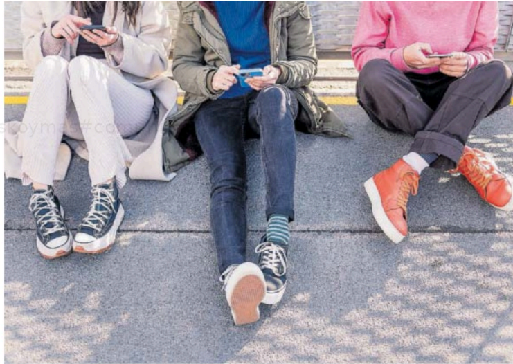
Tres adolescentes con sus móviles.