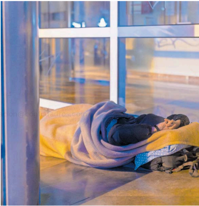
Una persona dormía en la calle, el día 3 en Barcelona.

Según Ricardo Gómez Carrera, "a pesar de que se han hecho algunos progresos en Europa o América, hay muchas regiones que están muy lejos de la igualdad". Por regiones, en los países más ricos hay menos desigualdad en este sentido: Europa, Japón, China o Estados Unidos. La brecha se agrava en África, Oriente Próximo o América Latina. "Lo que necesitamos son acciones políticas, para reducir