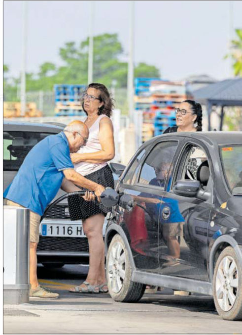
Usuarios en una gasolinera de Sevilla, ayer.

Pero eso no quiere decir que ahora mismo no operen también factores en contra. De hecho, tanto la gasolina como el gasóleo llevan cinco semanas seguidas subiendo. El importe medio ha au-